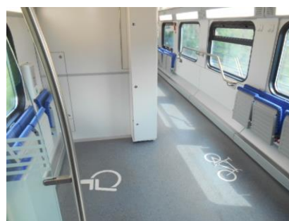
ドイツ鉄道の車イス対応車両

ポイント：視察費用は含まれます。現地では 日本語通訳がご説明しますので質 問なども気軽に可能です。移動に はドイツ鉄道を利用いたしますの で列車の旅も体験可能です。車イ ス対応の車両などもご覧いただき ます。