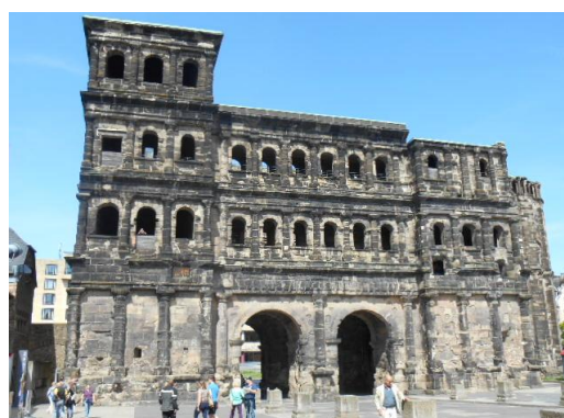
トリアにあるドイツ最古のローマ軍の門