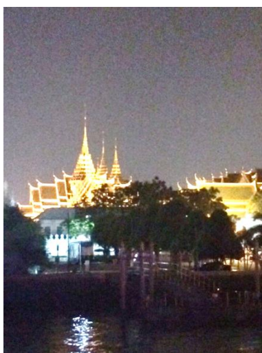
ディナークルーズから見た王宮のライトアップ