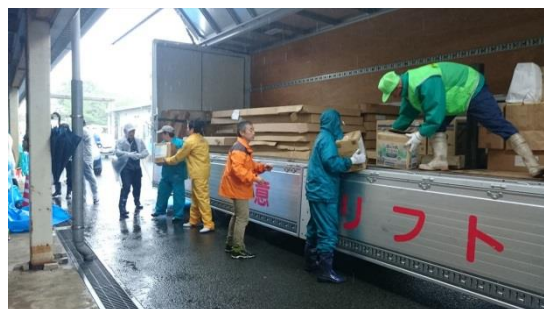
北区役所で救援物資を下ろす