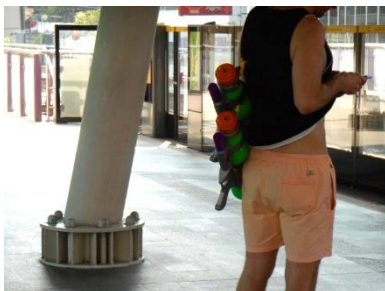
ウォーターガン…BTSを待つ人はウォーターガンを2本も

今回出かけたのがちょうどタイの旧正月にあたる時期でした。ソンクランという水かけ祭りの真っ最中という嬉しくも悲しい旅行でした。街を歩いていると巨大な水鉄砲でビチャー！と水を掛