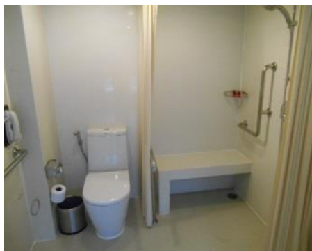
ホテルの身障者室のトイレとシャワー。バスタブもあります。

室を増やしてグループ旅行にも使いやすく改装してくれました。セールスマネージャーさんが一度泊まってみてくれと何度も連絡してくださったので宿泊してみました。建物に入るスロープも完備