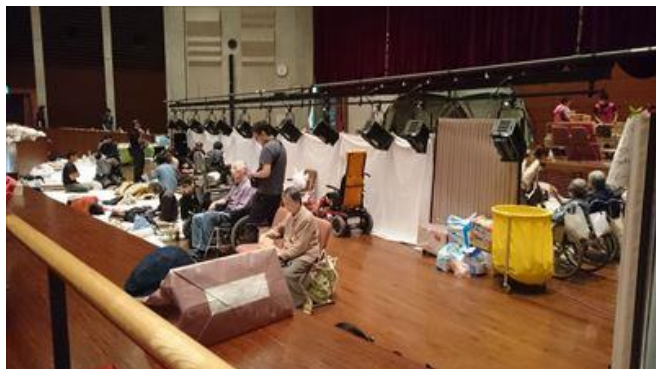
講堂の照明用のバトンを下ろし白幕を張って男女を区画

14 号館 1 階講堂の一角には福祉コーナーが作られ、教員や学生などがボランティアで見事に対応していました。社会福祉学部をかかえ、資材や人材に恵まれていたことも奏功しました。一般避難所として唯一、被災した障害者を受け入れる態勢を整えたことが注目されます。