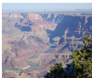
グランドキャニオン

ポイント：全行程リフト付き大型バス利用。 お食事や観光が組み込まれており 安心プランです。