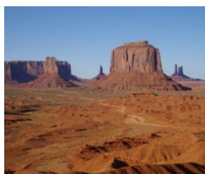
モニュメントバレー