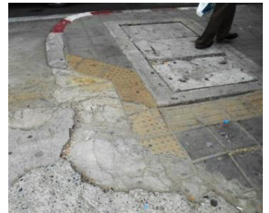
段差を無くすためにコンクリートで補修したら点字ブロックが…

とイヤミを言いましたら「恥ずかしい。」と答えていました。でもタイ人の優しさは自慢できるものだと感じています。一日中調査に付き合ってくれましたから。