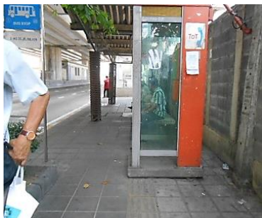
点字ブロック上の公衆電話

日本では一般的になった視覚障害者誘導用ブロック（点字ブロック）が、バンコクの町では笑えるような設置状況でした。誘導路の上に電話ボックスが置いて