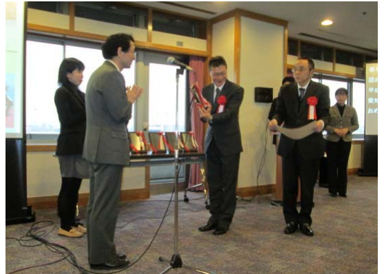
人にやさしい街づくり賞「特別賞」の授賞式

これも皆様から応援をいただき、ずっとご利用いただけたおかげと深く感謝申し上げます。