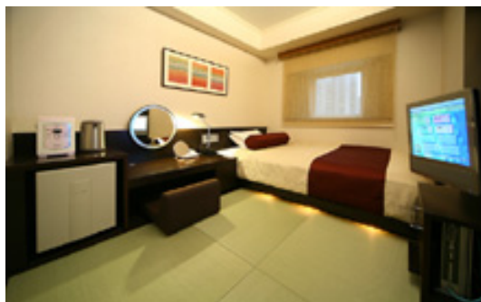
ホテルの客室 テレビの音は思ったより廊下に響きます。

✎ ホテルのお部屋は自宅にいるような感じでくつろげるものです。お風呂に入るときに補聴器をはずしてついそのままテレビをご覧になられたようです。気をつけましょう。