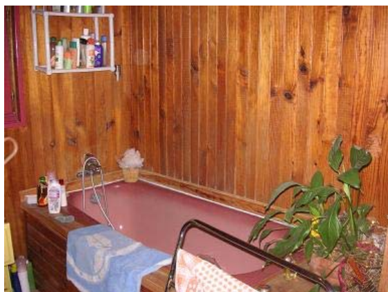
外国のお風呂はあふれたら大変。

外国で深夜遅くまで街を歩き、ホテルの部屋に戻ってからお風呂に入ろうとお湯をためていらっしやったのですが、そのまま二人とも寝てしまい部屋中が水びたしとなり、すぐ下の階にあったレストランの天井からもあふれた水が大量に落ちてきた。