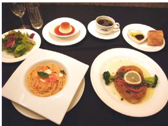
フルコース メニューの一例 ナイフ・フォークの使い方はやっぱり緊張します。

高級レストランでのフルコースディナー。聴覚障がいのある方がナイフとフォークを勢いよくお皿の上に置くため、「ガチャン！」とすごい音が。まわりの方はマナーが悪いと気分を悪くなさせてしまった。