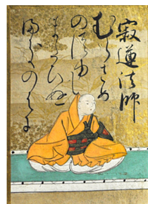
村雨の露もまだひぬ櫛の葉に 霧立ちのぼる秋の夕暮れ

ある時百人一首をやるというので、これならと期待した。「むらさめの～」というので、上の句を読んで下の句で取るのかと思ったら、知っている人は一人もいなかった。絵を見て女 3 点、男 5 点、天皇 10 点という内容でがっかりした。