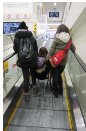
次の日、エスカレーター（動く歩道）を使った。